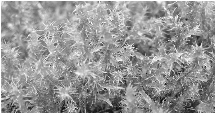
Abb. 5: Rhytidiadelphus squarrosus