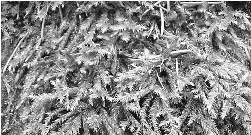
Abb. 2: Brachythecium rutabulum

Aufgrund seines häufigen Cannabis-Konsums gab ich ihm als erstes Cann-i., leider ohne Erfolg. Dann verschrieb ich ihm Brachythecium rutabulum . Darauf trat eine kontinuierliche Verbesserung ein. Er