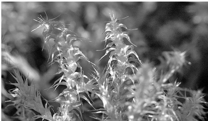
Abb. 5: Rhytidiadelphus squarrosus

Sie lehrt an einer Sonderschule für behinderte Kinder, ist sehr nervös und hat Magen-Darm-Probleme. Sie fühlt sich unsicher, nicht mutig, aber habe gelernt zu kämpfen, Dinge nicht hinzunehmen sondern