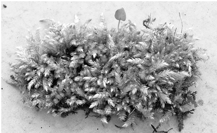
Abb. 1: Brachythecium rutabulum